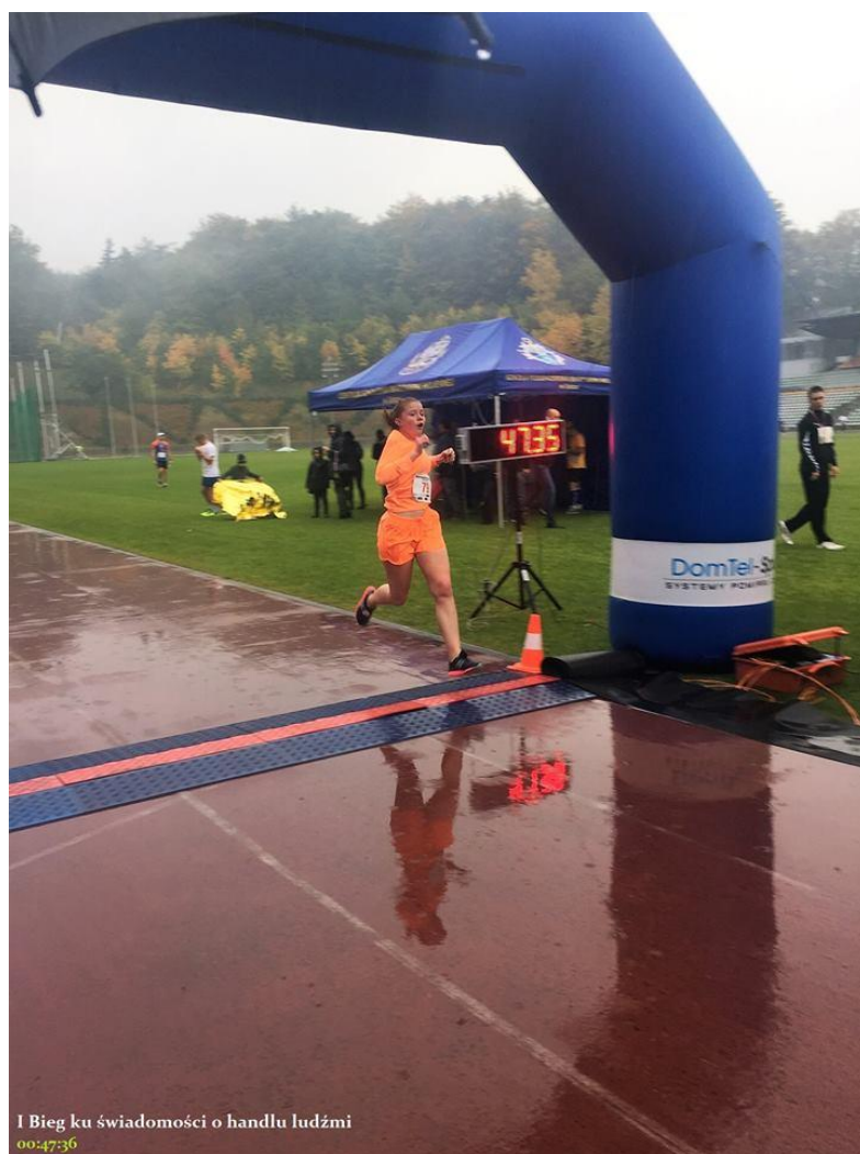
I Bieg ku świadomości o handlu ludźmi 00:47:36